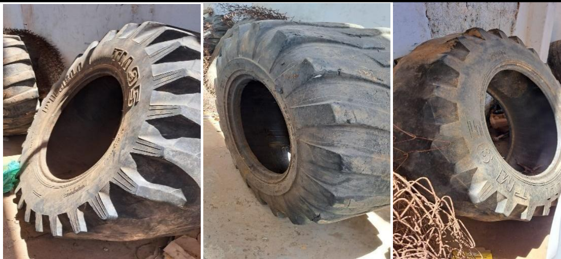
LOTE 10 – GRANDE QUANTIDADE DE PNEUS.

ESTADO DE ALAGOAS PREFEITURA DE BARRA DE SANTO ANTÔNIO