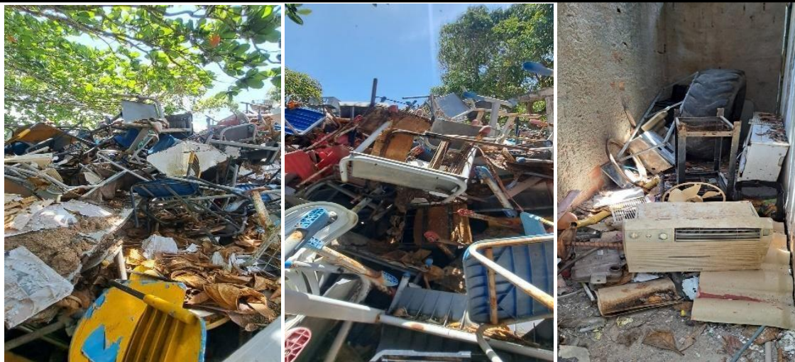
LOTE 11 – GRANDE QUANTIDADE DE CADEIRAS E SUCATAS.

ESTADO DE ALAGOAS PREFEITURA DE BARRA DE SANTO ANTÔNIO